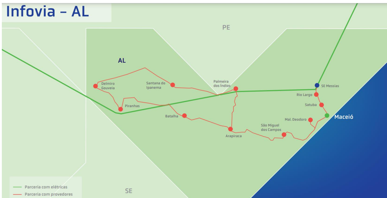
Figura 4. Infovia AL

A Figura 4 mostra as cidades de interesse da RNP para implantação de infraestrutura óptica complementar, bem como seus trechos de longa distância existentes, e de trechos de seu interesse para implantação.