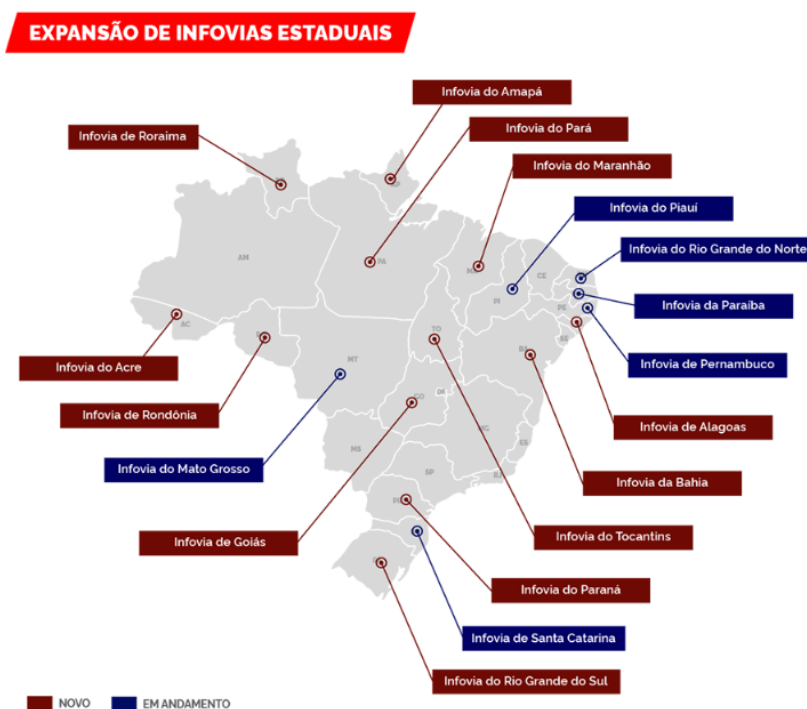
Figura 3: Infovias Estaduais

A Figura 3 apresenta as localidades onde a RNP implantará as Infovias nos estados.